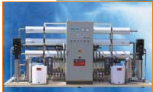
JUDO Umkehrosmose JOS 380 G