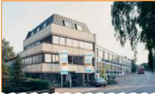
JUDO Wasseraufbereitung GmbH Winnenden