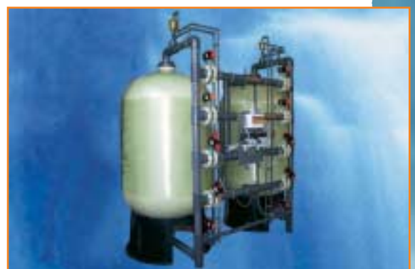
JUDO Festbettfiltration E-Reihe Automatik