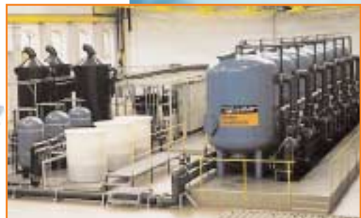
Wasserwerk Wujek, Polen