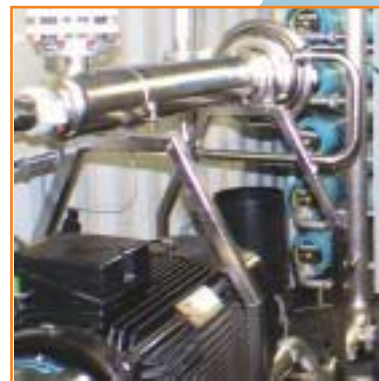
Hochdruckpumpe mit Energierückgewinnung

statt, um die Hygiene in den Trinkwasserspeichern sicher zu stellen. Alle Prozessschritte werden bei MAROS- Meerwasser-Entsalzungsanlagen über modernste SPS-Steuerungen automatisch kontrolliert und geregelt. Wichtige Informationen, wie die Wasserqualität oder die Durchflussleistungen werden visualisiert und sind über einen PC vor Ort oder Fernabfrage jederzeit abrufbar.