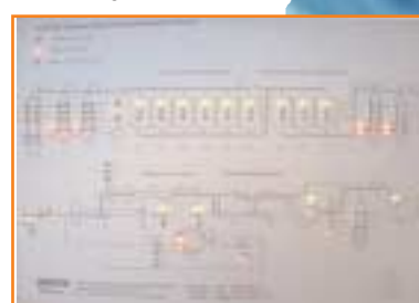
Blindschaltbild mit Leuchtdioden