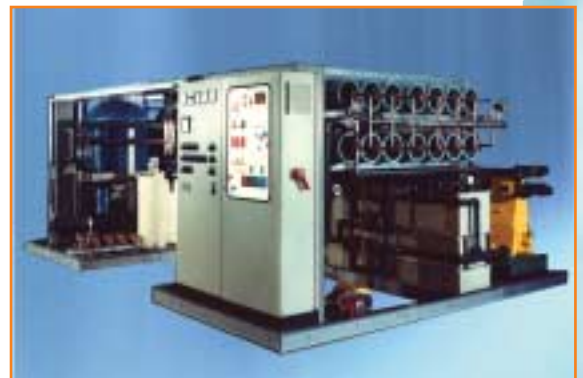
JUDO MAROS Meerwasserentsalzungsanlage