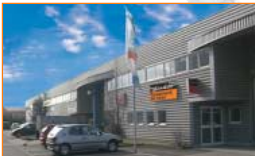
JUDO France, Strasbourg