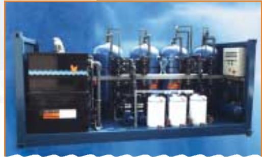
JUDO E-Reihe Festbettfiltration