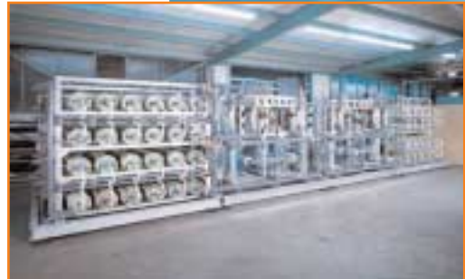
JUDO MAROS 1500