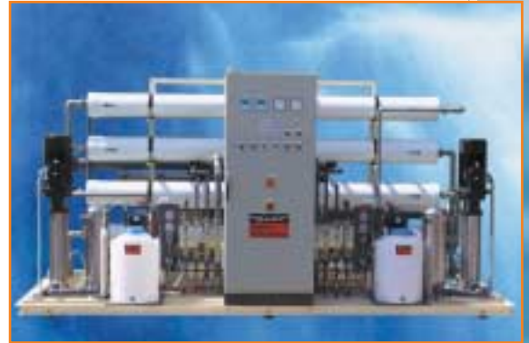
JUDO Umkehrosmose JOS

35 %. Je nach Kundenwunsch kann das produzierte Trinkwasser in seiner Mineralstoffzusammensetzung weiter optimiert werden, z.B. durch eine Aufhärtung über Schüttungen aus natürlichem Kalziumkarbonat. Als letzter Schritt findet üblicherweise eine Schutzchlorung