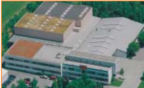
JUDO Wasseraufbereitung GmbH Waldrems R & D Center