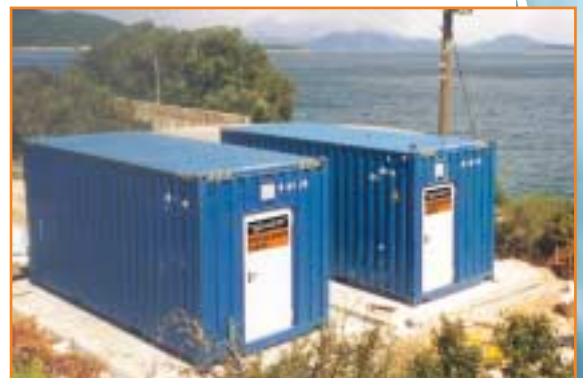
JUDO MAROS Meerwasserentsalzungsanlage in Griechenland