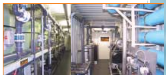
JUDO E-Reihe Filteranlage und JUDO Maros Entsalzungsanlage