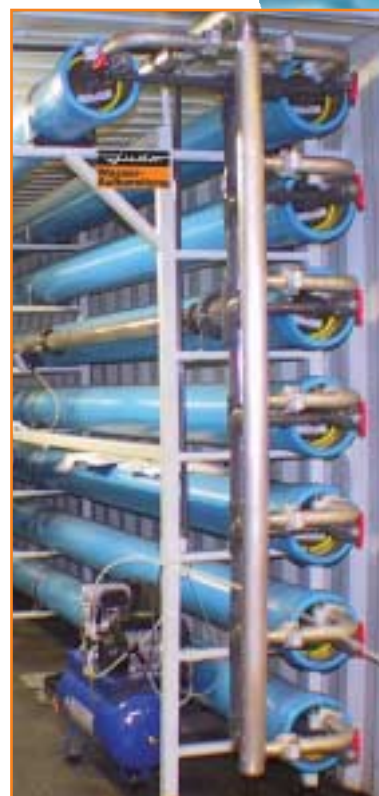
JOS Membranstapel mit Edelstahlverteiler