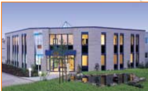
JUDO Wasseraufbereitung GmbH Hilden Verkaufsbüro