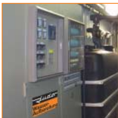
Schaltschrank mit SPS Steuerung