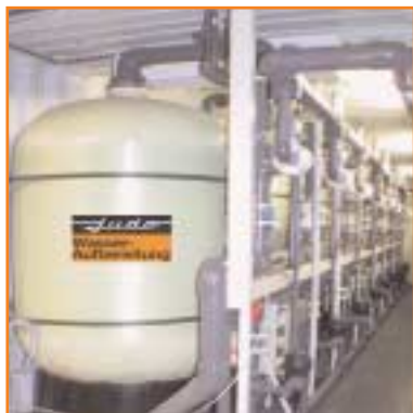
Vorbehandlung durch Mehrschichtfiltration

statt, um die Hygiene in den Trinkwasserspeichern sicher zu stellen. Alle Prozessschritte werden bei MAROS- Meerwasser-Entsalzungsanlagen über modernste SPS-Steuerungen automatisch kontrolliert und geregelt. Wichtige Informationen, wie die Wasserqualität oder die Durchflussleistungen werden visualisiert und sind über einen PC vor Ort oder Fernabfrage jederzeit abrufbar.