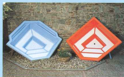
JUDO-Whirl-Pool Modell Cannes