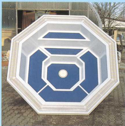
JUDO-Whirl-Pool Modell St. Tropez-Ü

Zubehör: Whirl-Pool-Gebläse, Luftvorheizer, Halogen-Unterwasserscheinwerfer, Edelstahl-Einstiegbügel. Das JUDO-Whirl-Pool-Aquapulso-System sorgt für weiteren »Auftrieb« im JUDO-Whirl-Pool, ermöglicht eine punktuelle Massage und ist mit stufenlos regelbarer Luftbeimischung ausgestattet.